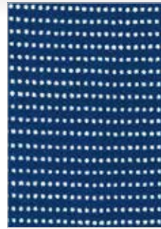
F-800 豆絞り (地染まり)