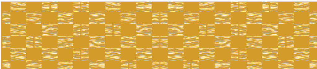
ST-120 よろけ市松 (黄)