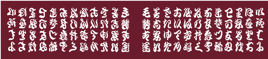
ST-101 いろは (エンジ)