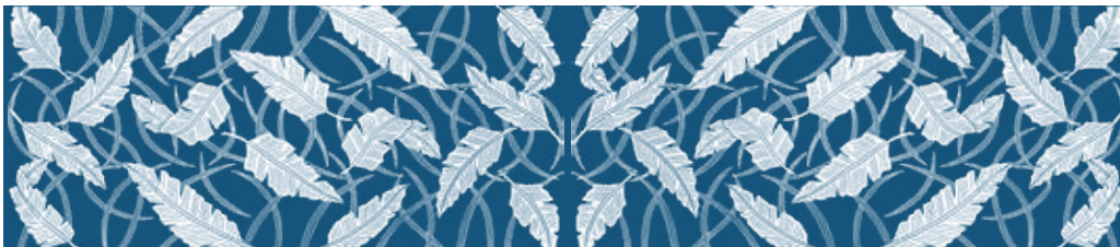
ST-110 芭蕉 (水色)