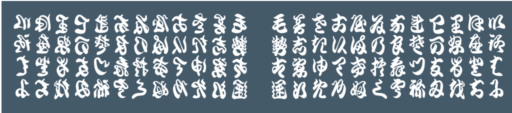
ST-100 いろは (グレー)

その素材の気持ち良さを生かしたくて、一年中お使いいただけるストールを作りました。