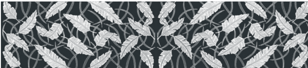
ST-111 芭蕉 (グレー)